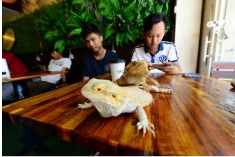
ラピタイルカフェ