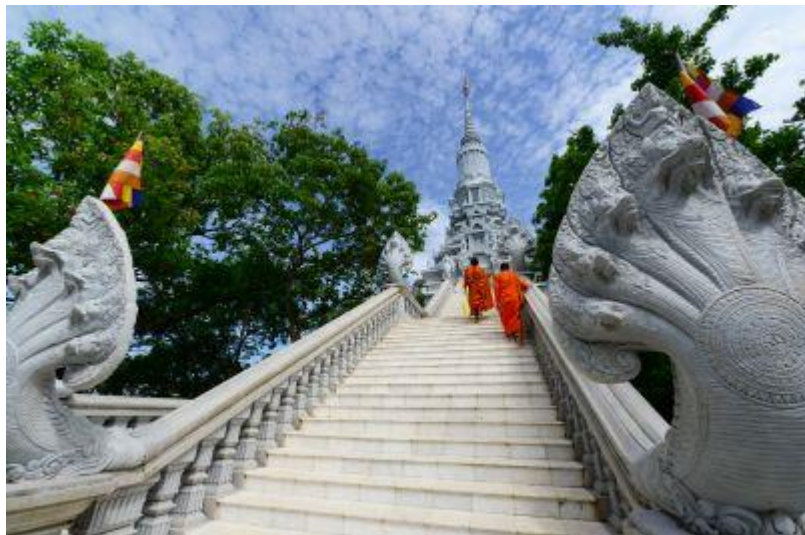
ウドン↑ ↓ プノンペンサファリ