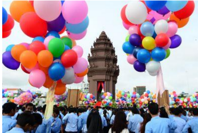
独立記念日↑ ↓国際ヨガデー