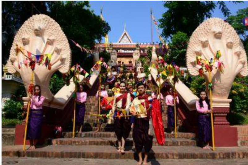
クメール正月↑ ↓マラソン