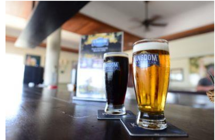
出来立てビール ↑ ↓ ボートクルーズ