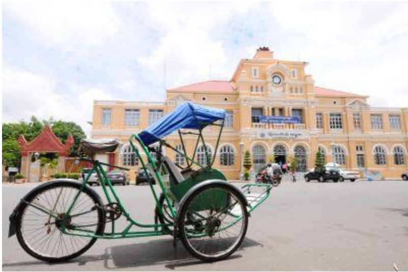
コロニアル時代の建築物↑ ↓中国寺