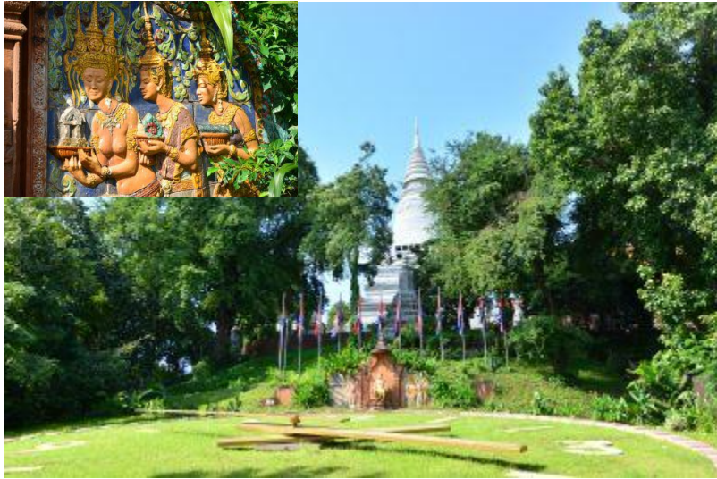
ワットプノン↑ ↓独立記念塔