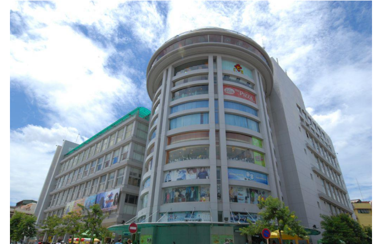
ソリアモール↑ ↓ロシアン