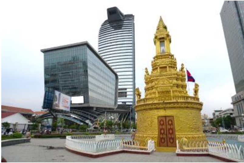
ストゥーパ↑ ↓シハヌーク前国王