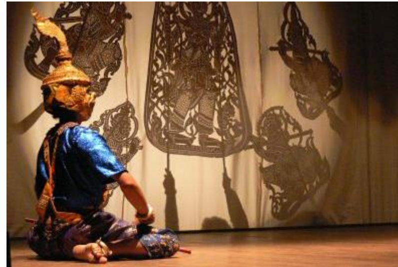
ソワナプム↑ ↓ネオン街