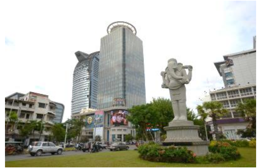
ガネーシャ↑ ↓Samdech Sang Chuon Nath