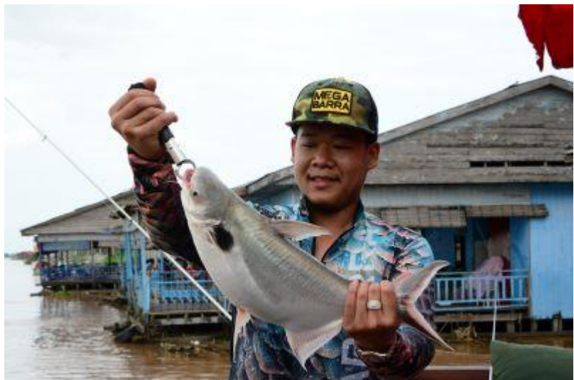
魚釣り↑ ↓ヘリテージツアーウクトウク