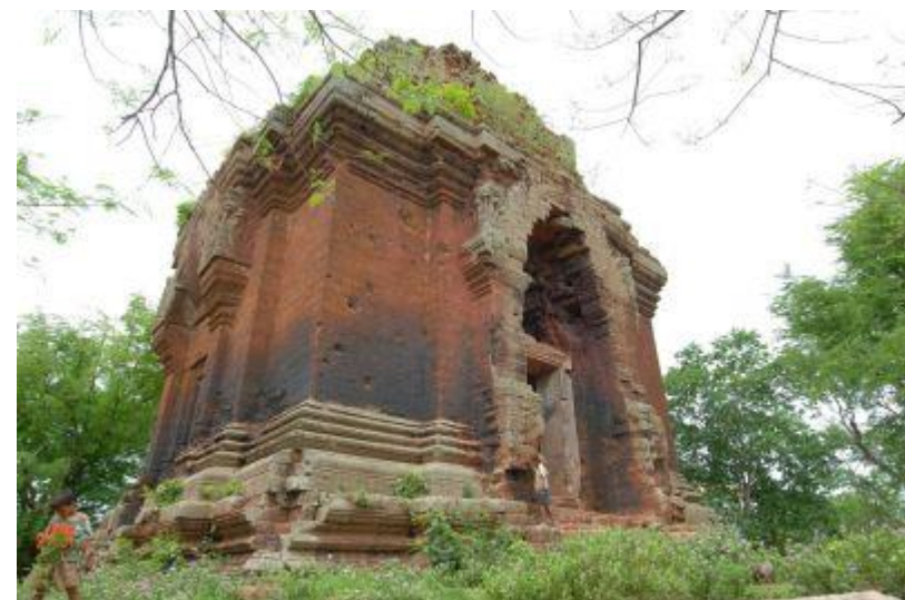
アンコールボレイ↑ ↓アオラル登山