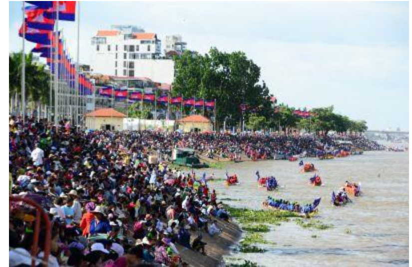
水祭り↑ ↓ヴィサカボチア (仏陀生誕祭)