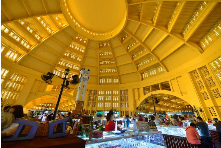
セントラル↑ ↓オリンピック