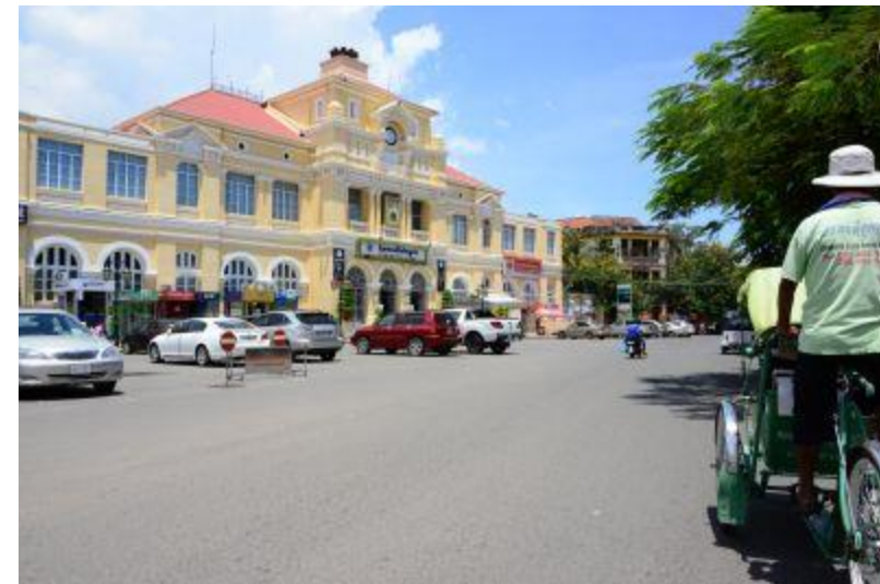
アーキテクチャーツアー↑ ↓クライミング