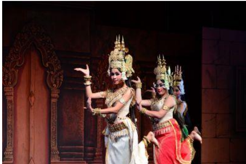
リビングアート↑ ↓サバイサバイキャバレー