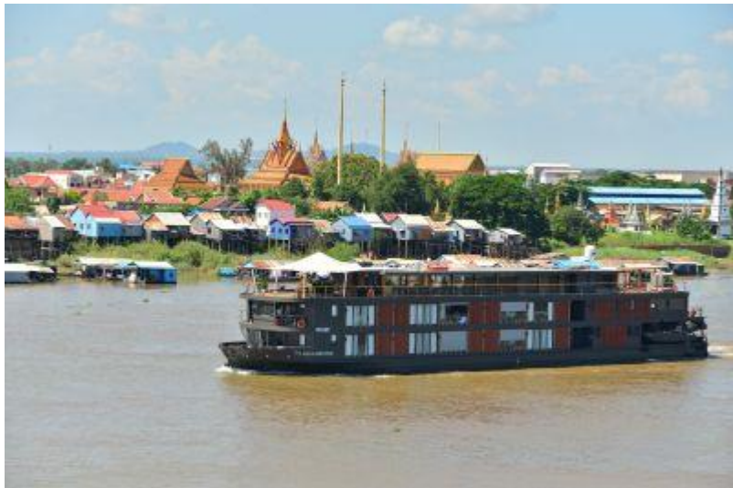
アクアメコン↑ ↓銀細工の村