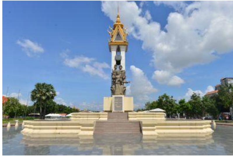
ベトナムカンボジア友好の塔↑ ↓銃撲滅