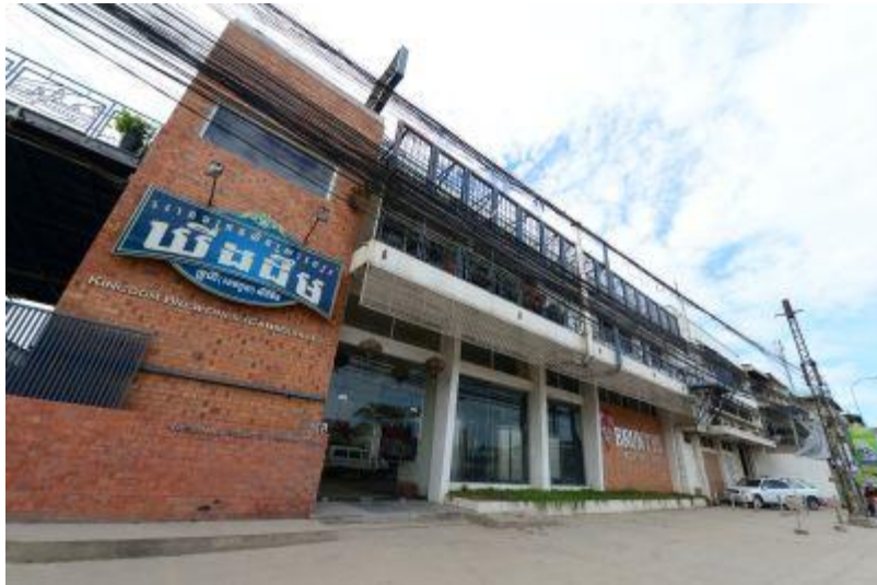
ビール工場 ↑ ↓ ウナロム寺院