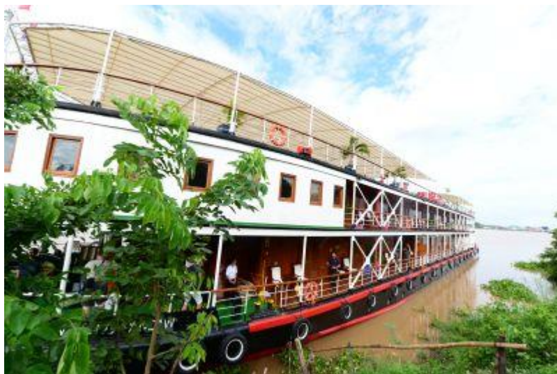
パンダウ↑ ↓牛車体験