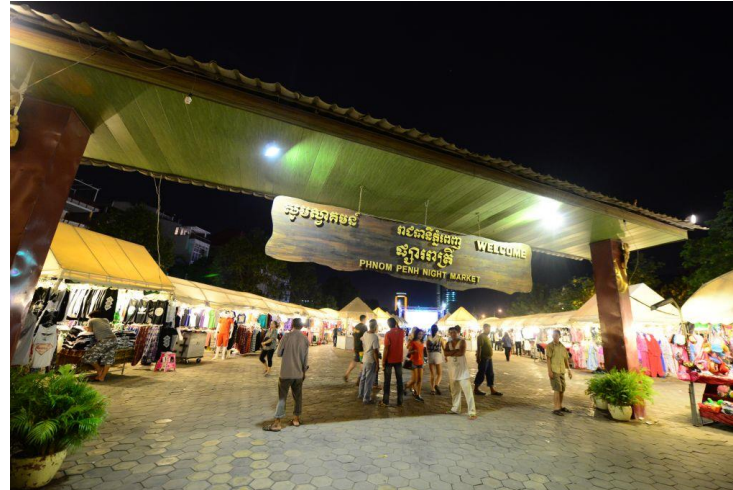
ナイトマーケット↑ ↓カンダール