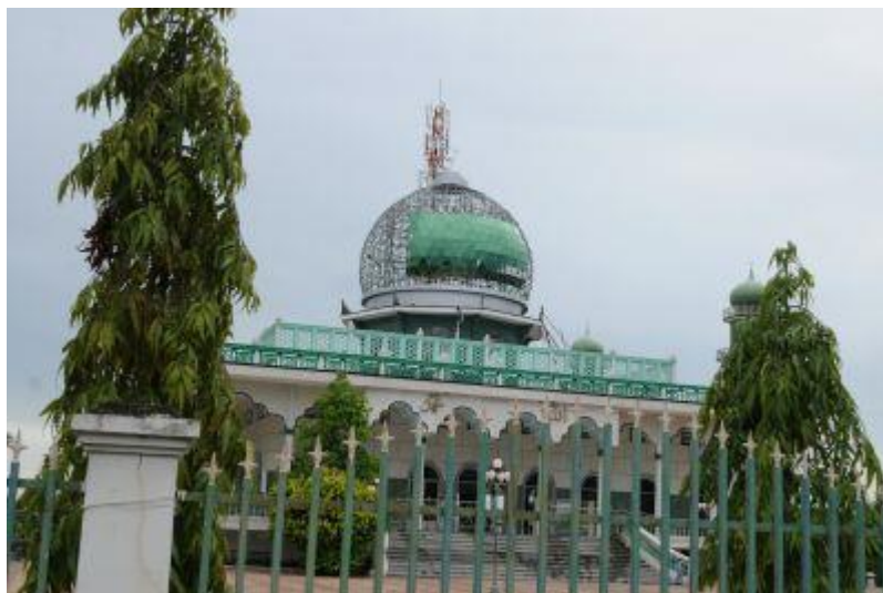
モスク↑ ↓ 市内モスク