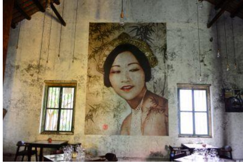
チャイニーズハウス↑ ↓古い教会