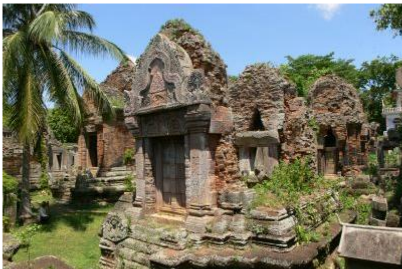
プノンチソー↑ ↓タマウ野生動物保護区