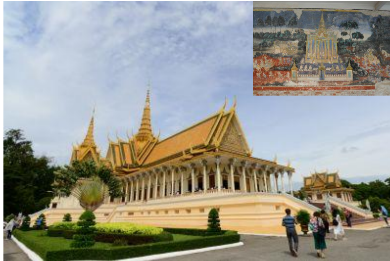
王宮・シルバーパゴダ↑ ↓キリングフィールド