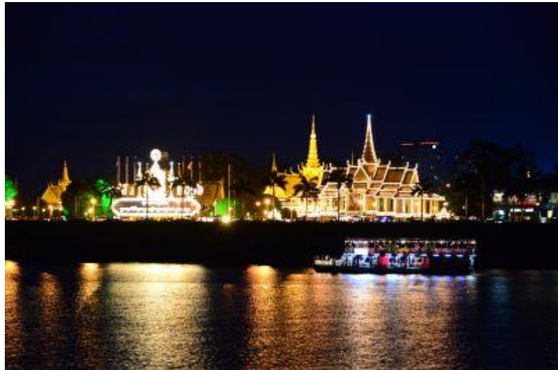
リパークルーズ↑ ↓ピョンヤン