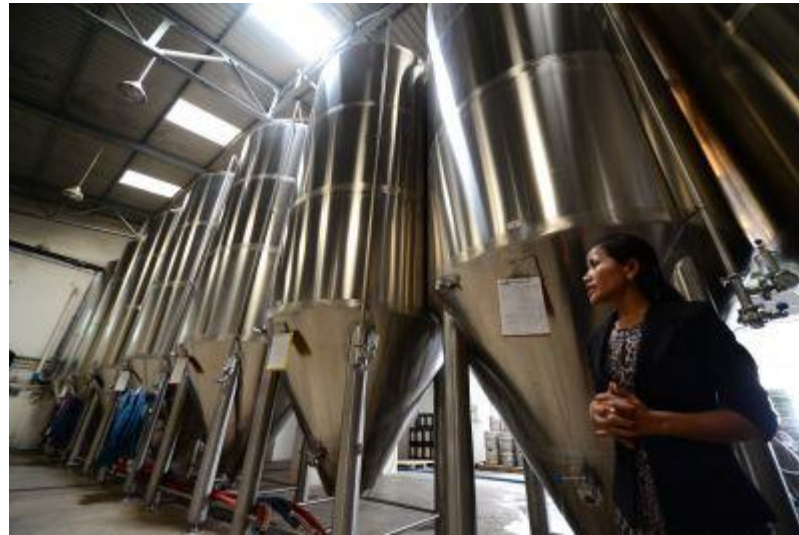
工場見学 ↑ ↓ 日本支援のバス