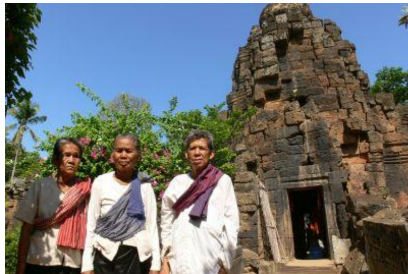
タブローム↑ ↓チョンボック (キリロム)