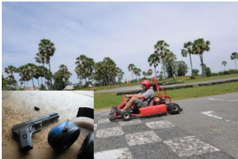
ゴーカート↑ ↓ボクシング