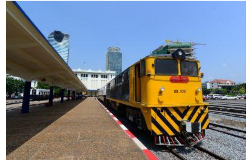
ブノンペン駅↑ ↓ワットブノン橋