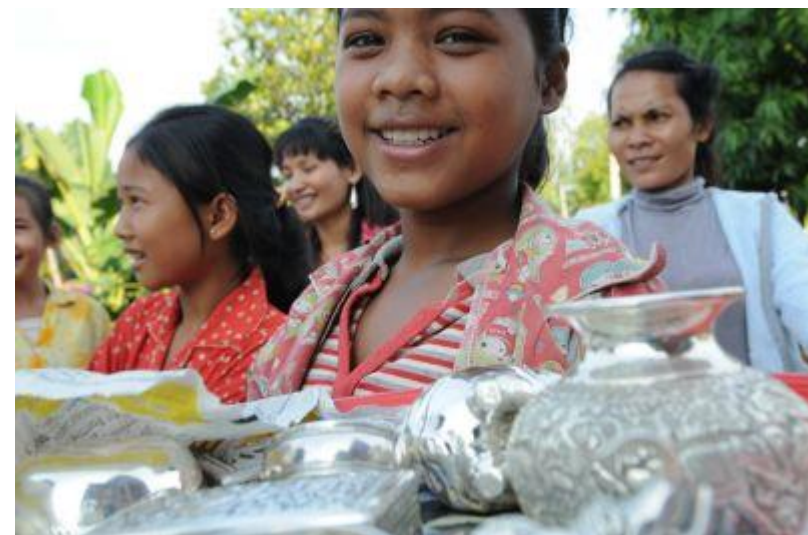
銀細工村↑ ↓ シルクアイランド