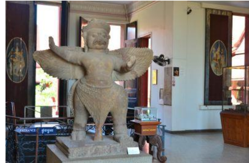
博物館↑ ↓トゥールスレン博物館